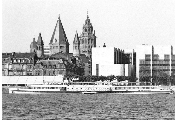
Raddampfer Mainz auf dem Rhein bei Mainz, 1929

Anmeldung beim Museum erforderlich bis 23. Mai (mit Angabe der Teilnahme an Schlusseinkehr wegen Tischreservierung!). Teilnahme nur nach Bestätigung von uns möglich.