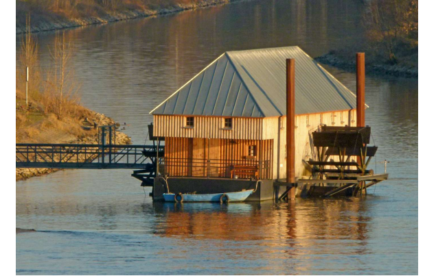
Ginsheimer Schiffsmühle (Herbert Jack)

Anmeldung mit vollständigen Kontaktdaten beim Museum erforderlich bis 31. Mai. Teilnahme nur nach Bestätigung von uns möglich.