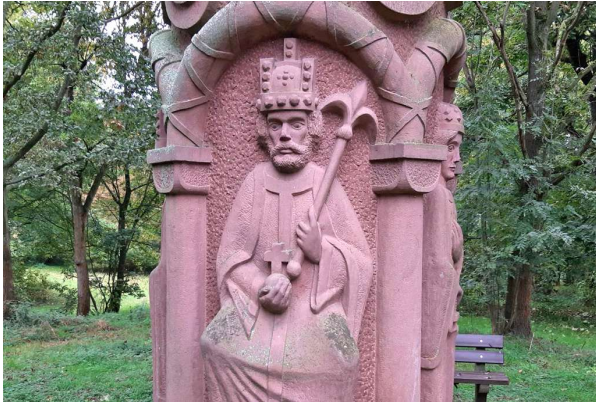
Barbarossa-Säule auf der Maaraue